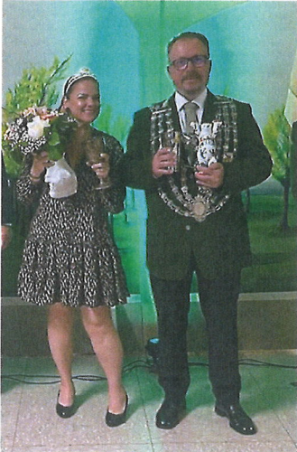
Grußwort des Königshauses